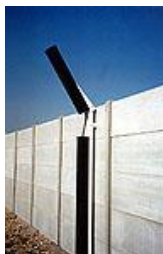
Barrière infrarouge Maxiris bâvolet

Notre entreprise conçoit et commercialise des barrières infrarouge anti-intrusion. Nous sommes leader en France sur un marché de niche.